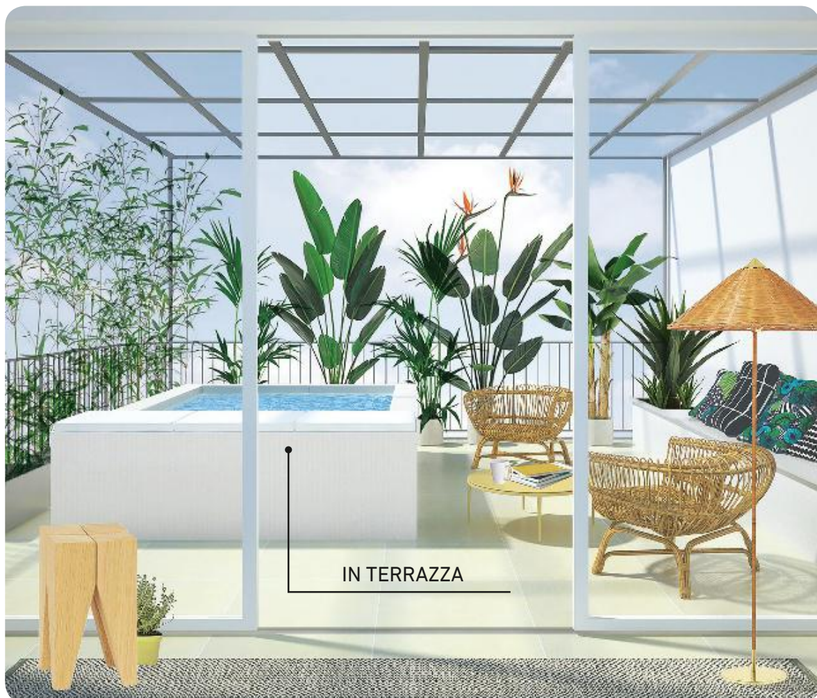
Le stylist hanno abbinato alla piscina Playa Living lo sgabello Backenzahn [e15], il tappeto Ingrid [Kasthall], la lampada da terra Tynell [Gubi], le sedie e il tavolino [De Padova], i cuscini [Marimekko].

J UNGLE IN TERRAZZA... per un tuffo tra le nuvole. La piscina Playa Living è l'indiscussa protagonista in questa terrazza di circa 25 mq circondata da piante che creano un piacevole effetto giungla urbana e rafforzano la relazione acqua/natura. Le fibre tessute a mano che rivestono la piscina si 'connettono' alla canna intrecciata delle poltrone e la sensazione naturale continua con il pavimento in pietra di Trani che crea continuità tra interno ed esterno. Anche la scelta delle lampade concorre a creare un'atmosfera esotica e rilassante. Ma l'installazione? Facile a qualsiasi piano! Playa Living è componibile, si smonta e si carica in ascensore. E si riempie in sole due ore.